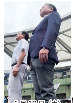
6月10日(土) 中総体開会式