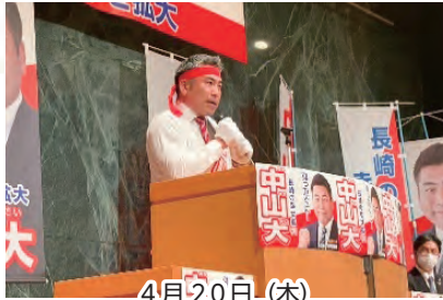
4月20日(木) 総決起集会