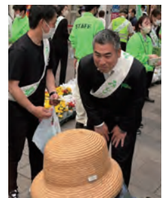
写真：緑の募金活動

今、長崎市は、100年に一度の変革期と言われ、新しい街の 基盤が生まれつつあります。その一方で、急速に進む「人口減少・流出」 の課題に対し、真正面に向かい果敢に挑戦しなければなりません。 市民の皆さんに寄り添いながら、その声も地方議会に届けていくと共に、魅力あふれ る長崎の創造に取り組みます。その役割と使命を果たすために、引き続きの ご指導とご支援を宜しくお願い致します。