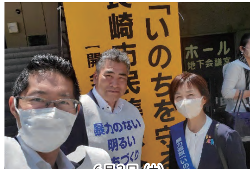
6月3日(土) 「命を守る」長崎市民集会