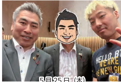
5月25日(木) 長崎ヴェルカ B1 昇格報告会