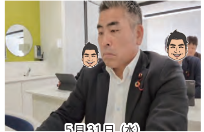
5月31日(水) 新人議員研修会