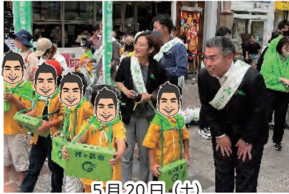
5月20日(土) 緑の募金活動