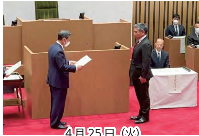
4月25日(火) 当選証書授与式