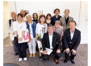
写真：6月定例会 市政一般質問にて