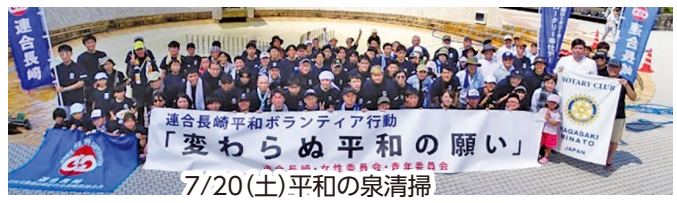
連合長崎平和ボランティア行動 「変わらぬ平和の願い」 7/20(土) 平和の泉清掃