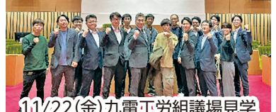
11/22(金) 九電工労組議場見学