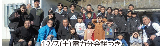
12/7(土) 電力分会餅つき