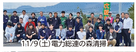
11/9(土) 電力総連の森清掃