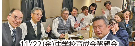
11/22(金) 中学校育成会懇親会