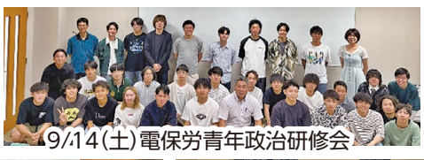
9/14(土) 電保労青年政治研修会